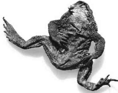
Dry jumping frog, 1998